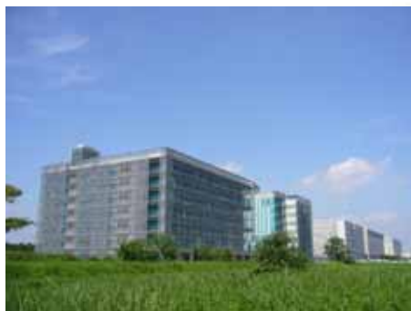
東大柏キャンパス

2012年12月25日 28日(3泊4日) 25日(火):上京 午後 - 東大植物生存システム 研究室、見学とオリエンテーション 26日(水):ゼミ1、ゼミ2 27日(木):ゼミ3、ゼミ4 28日(金):上野の科学博物館展示学習 テーマ:進化、帰岡 予告:事前研修と受講レポートがあります。募集 人数:5名程度