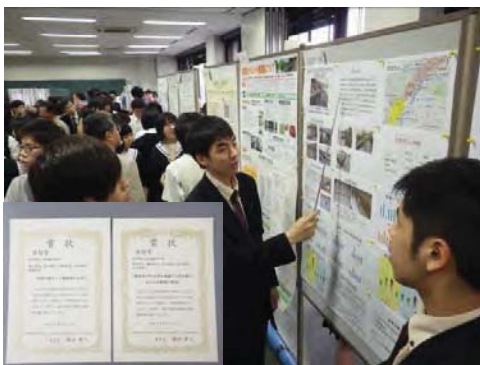
図3 生物系三学会に参加し奨励賞を受賞