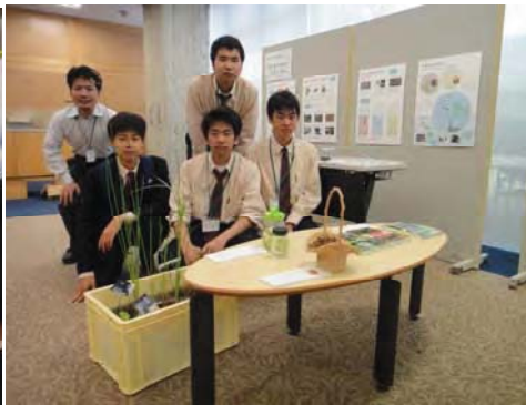
図4 児島湖流域フォーラムに参加