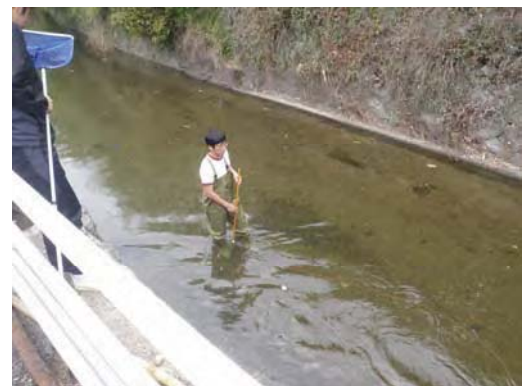
図2 自作した6mのヒモを付けたピン球を流し、ヒモが張るまでの時間を計り流速を計算します。

また、地域への貢献を目的として西川の清掃に参加し、地元の小学生と一緒に川の生き物観察も行いました(図5)。