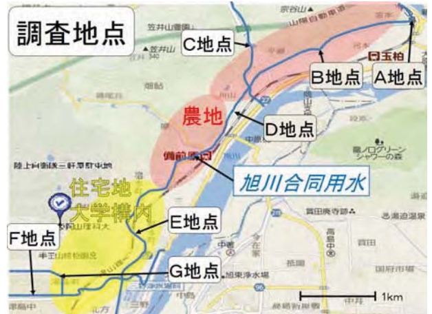
図1 玉柏から宿本町、三野へと流下する旭川合同用水が研究フィールドです。

5月11日に徳島大学で行われた生物系三学会で研究の成果を発表し、奨励賞を受賞しました(図3)。